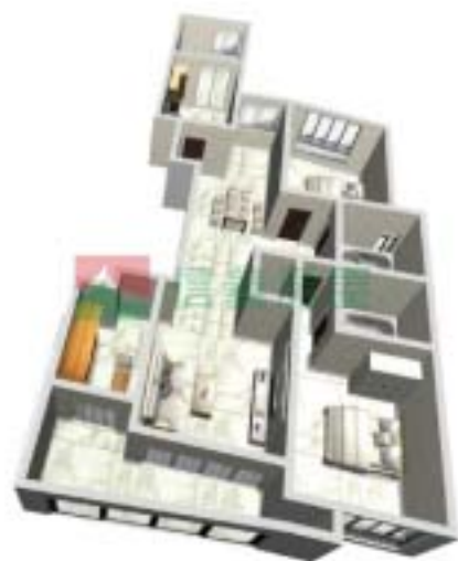
6号楼康泰府C型户型图