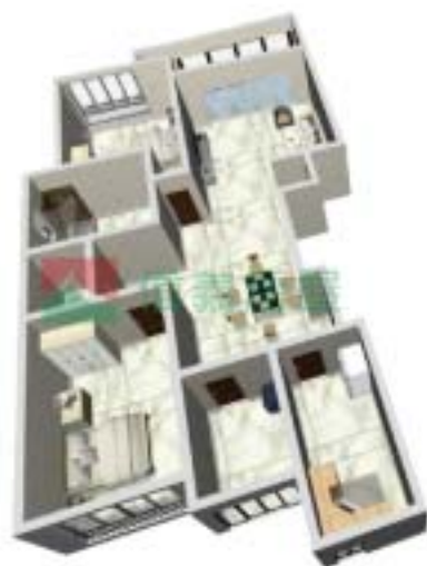
2号楼安泰府A型户型图