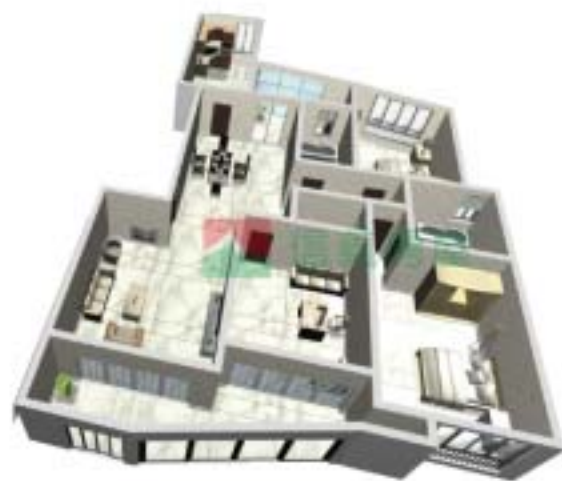
4号楼宁泰府A型2单元户型图