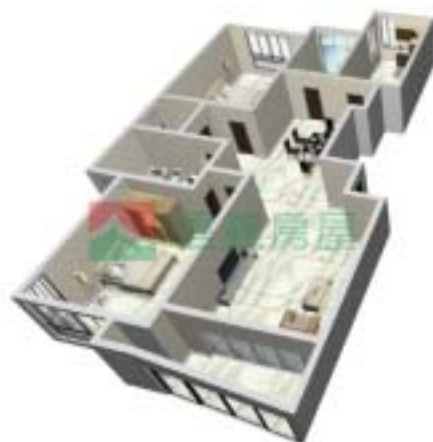
4号楼宁泰府B型2单元户型图