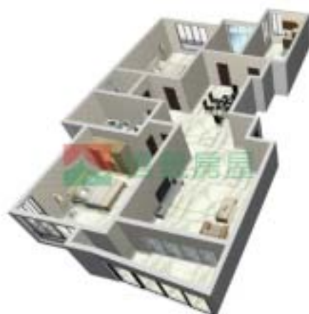
4号楼宁泰府B型1单元户型图