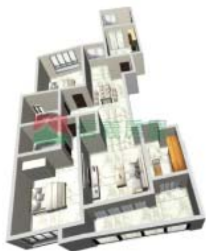
6号楼康泰府D型户型图