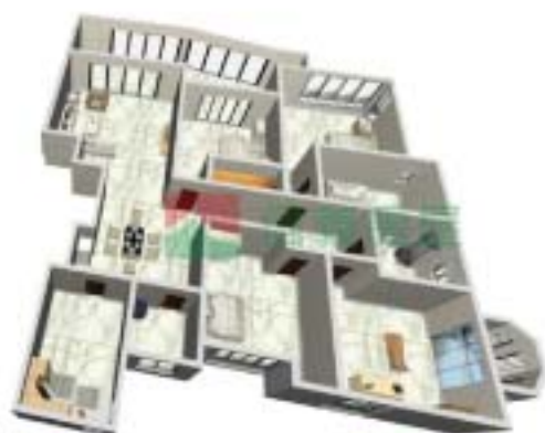
1号楼安泰府C型户型图