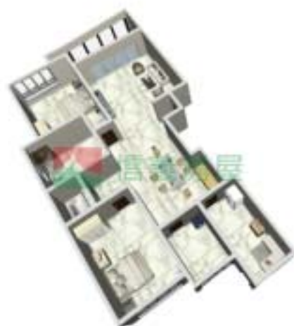
3号楼宁泰府B型1单元户型图