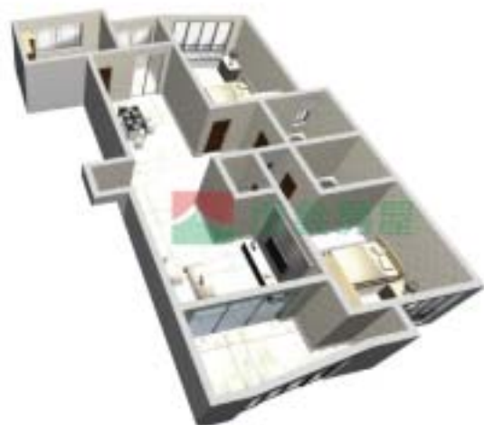
7号楼康泰府E型户型图