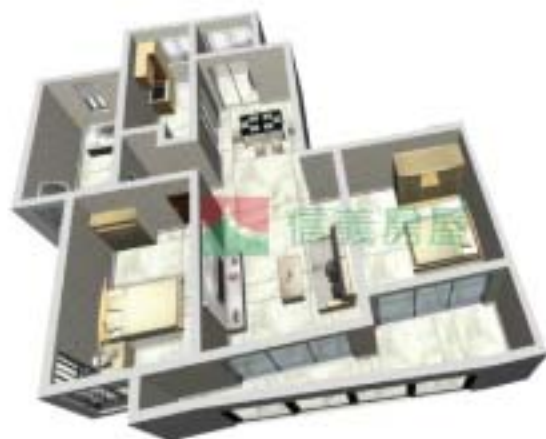
7号楼康泰府F型户型图