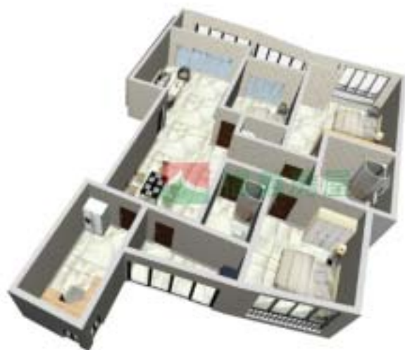
2号楼安泰府B型户型图