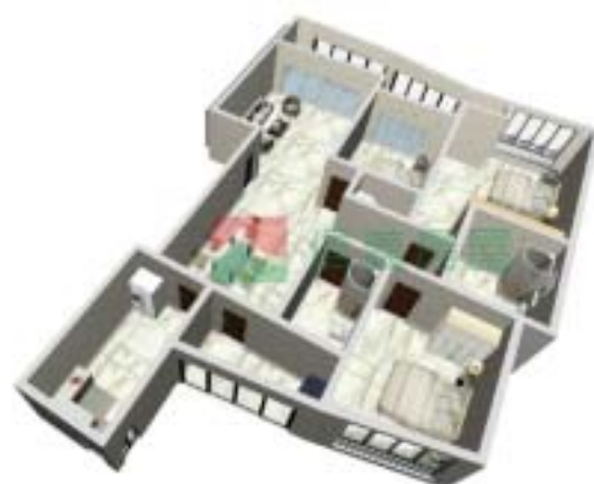
3号楼宁泰府A型2单元户型图