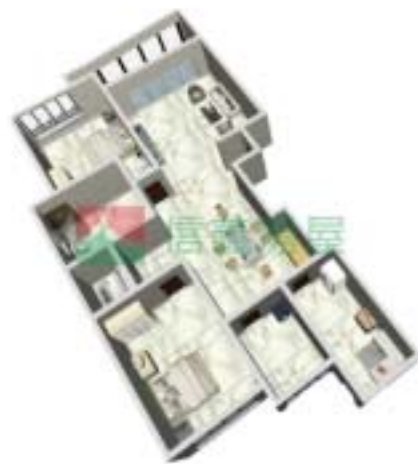
3号楼宁泰府B型2单元户型图