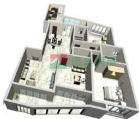
4号楼宁泰府A型1单元户型图