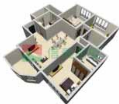
4号楼4单元1~38层户型图