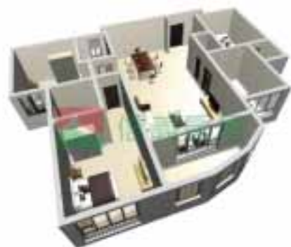
5号楼2单元1-38层户型图