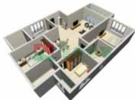
5号楼3单元1-38层户型图