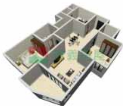
3号楼2单元1~38层户型图