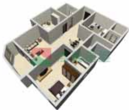
3号楼3单元1~38层户型图