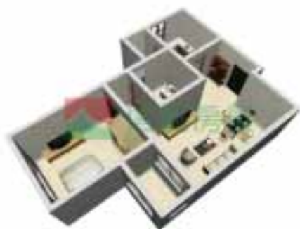
9号楼2单元1~38层户型图