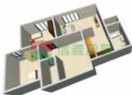
7号楼2单元1-38层户型图