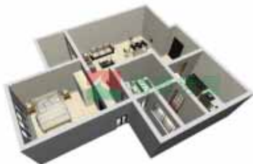
10号楼3单元1-38层户型图