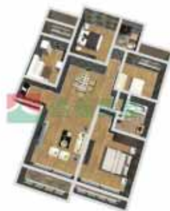
6号楼1单元1-38层户型图