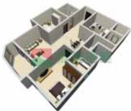
1号楼3单元1~38层户型图