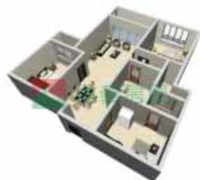
10号楼2单元1-38层户型图