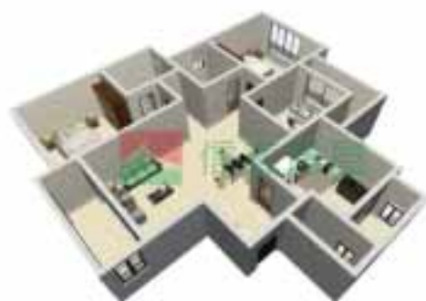
10号楼4单元1-38层户型图