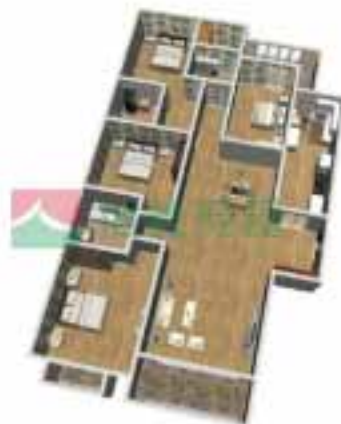
6号楼3单元1-38层户型图