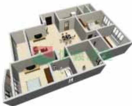
7号楼1单元1-38层户型图