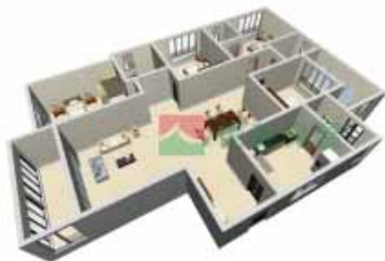
7号楼3单元1-38层户型图