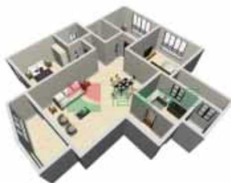
4号楼1单元1~38层户型图