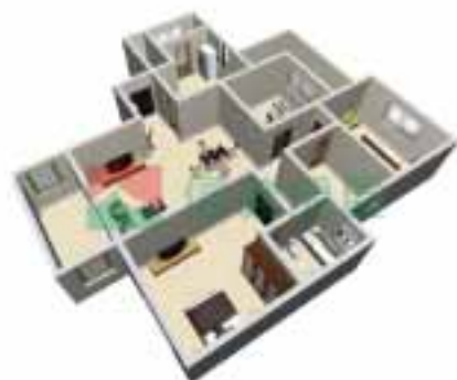
9号楼1单元1~38层户型图