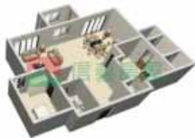
8号楼2单元1-38层户型图