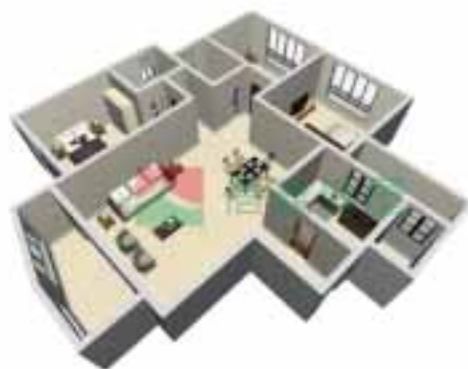
2号楼1单元1~38层户型图