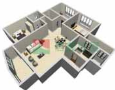
1号楼4单元1~38层户型图