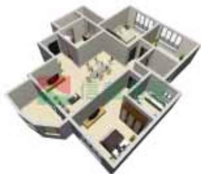
1号楼1单元1~38层户型图