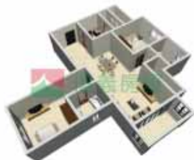
10号楼1单元1-38层户型图