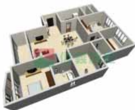
8号楼3单元1~38层户型图