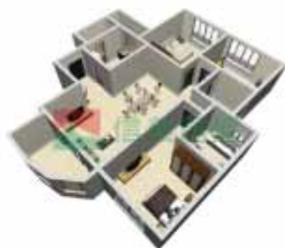
3号楼1单元1~38层户型图