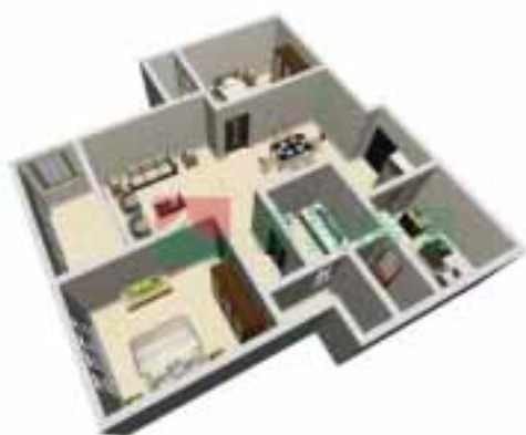
9号楼3单元1~38层户型图