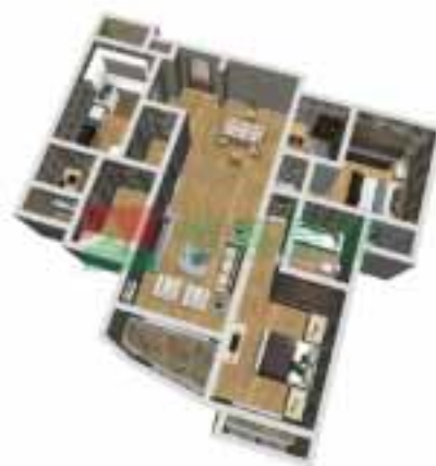
6号楼2单元1-38层户型图