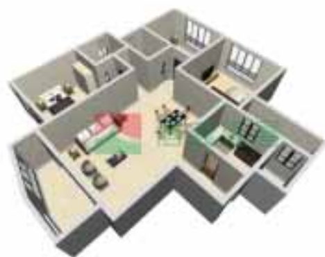
3号楼4单元1~38层户型图