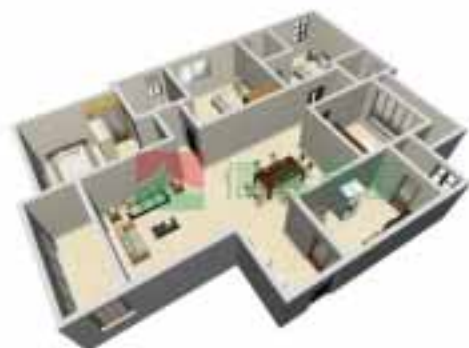
8号楼1单元1-38层户型图