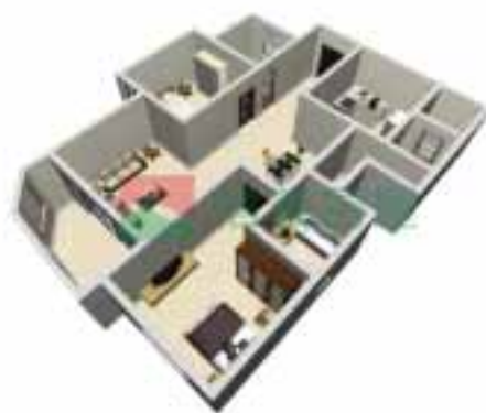
2号楼2单元1~38层户型图