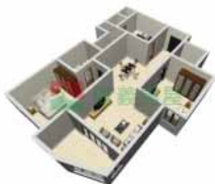
1号楼2单元1~38层户型图