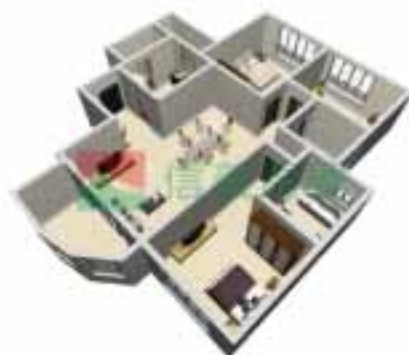
2号楼4单元1~38层户型图