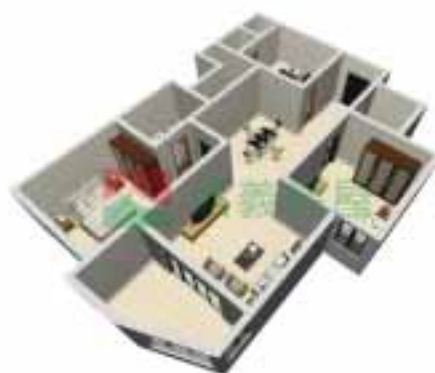
2号楼3单元1~38层户型图