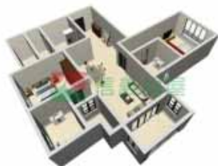
9号楼4单元1~38层户型图