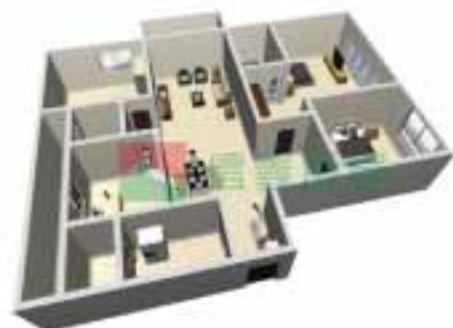
5号楼1单元1-38层户型图