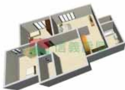
8号楼2单元1~38层户型图